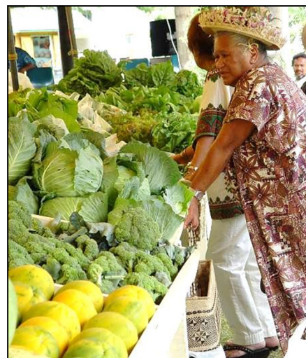
Kare ko te kai anake te mea e ora'i te tangata, ko te tuatua-tika ra mei ko mai i te Atua.

E rua taime i te mataiti e akaputu ana tatou i te kai ei tauturu i ta tatou anau apianga tei noo ki roto i te puna vai ora koia a Takamoa. E na runga ana teia tuanga marama i nga Ekalesia e 6 i Rarotonga nei. Te au kai ravarai te apaiia ana no teia akakoroanga. Ko te Ekalesia Matavera tetai e maroiroi nei i te apai i teia tuanga i te au atiangaravarai, i na te au arataki mai ei o Takamoa.