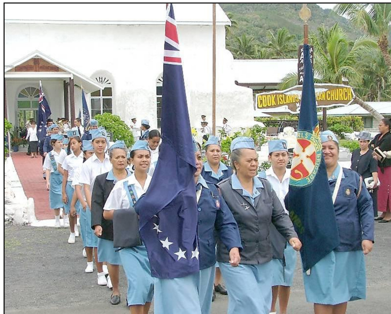
Girls' Brigade i te tuatau o te Uipaanga Maata, 2005

Kare i akatinamouia ake te arataki o teia putuputuanga no tetai tuatau roa (13 mataiti i teia mataiti 2008) no tetai au tumuanga. Te riro nei ra te nga opita i roto i teia taokotaianga i te tiaki i teia taoanga.