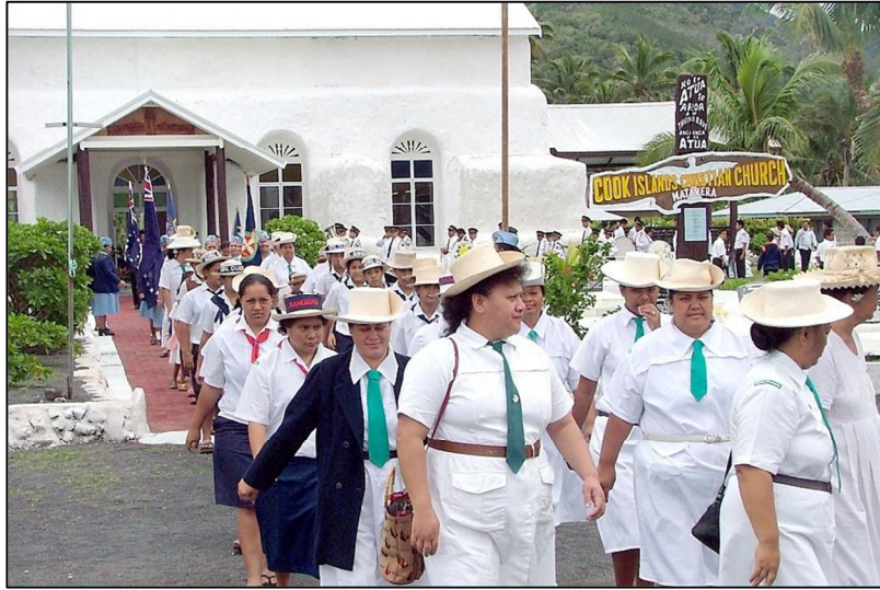
Girl Guides i te tuatau o te Uipaanga Maata, 2005