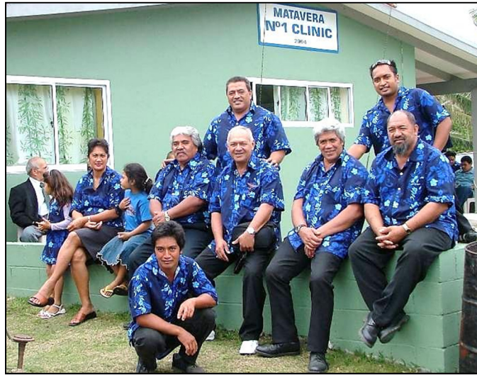
Te akangaroi marie uake nei mei tetai akakoroanga o te Ekalesia

anga i te tuatua tapu na te Atua ma te akamatutu anga i te au mema Ekalesia kia tu katau i te raveanga i te angaanga nana. Kare oki teia e rave akaouia ana i roto i ta tatou nei Ekalesia kua roa i teiane, tetai tumu maata koia oki kare o nga tapere Vaenga/Pouara e Rotopu Are Uipaanga akaou.