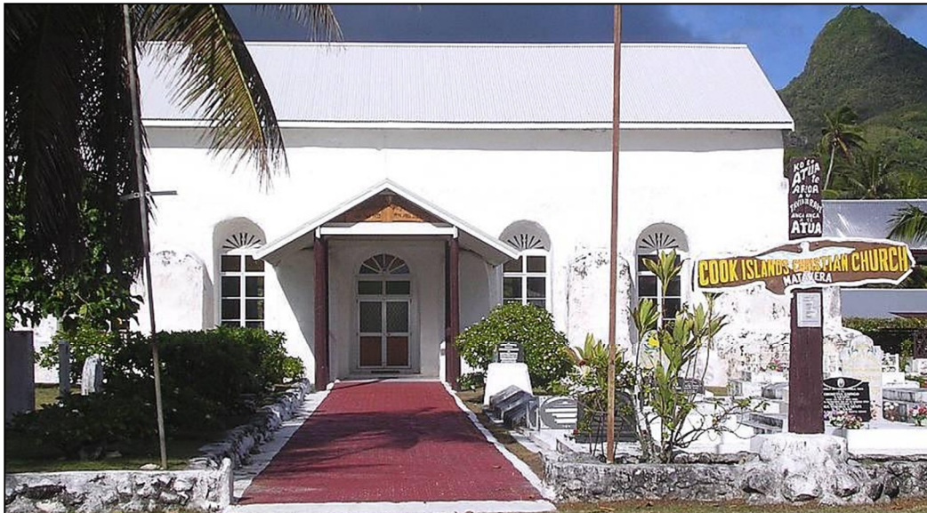
Are Pure Silo – Ngutupa ki te Rangī; Maunga Ruaenga ki te tua katau