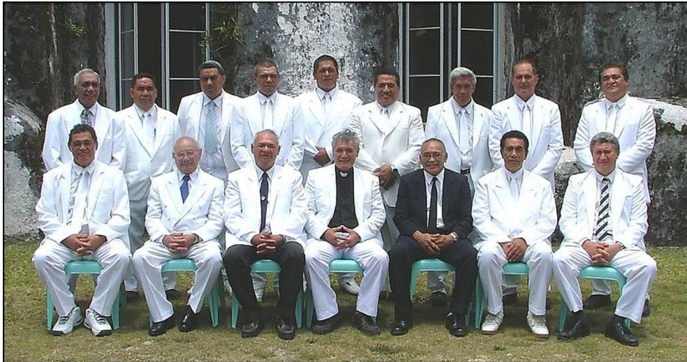
UIPAANGA DIAKONO, 2004