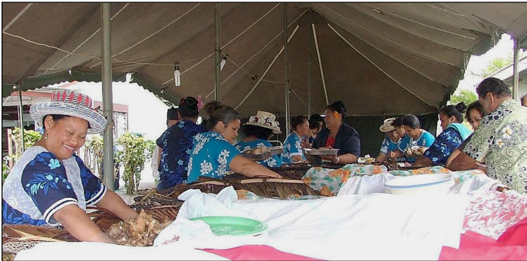
Ko teia mea e kai, e tuatua ana tetai pae e, maata roa te kaikai i roto i ta tatou akonoanga CICC. Ei manako pau, ko tetai teia i te venereka o te Evangelia ora a to tatou Atua.

Penei ka ui tetai pae, eaa ka tauruia mai ei teia au manamanata ki roto i teia tataanga? Pauanga, ko tetai tuanga rai teia tei tupu i roto i te Ekalesia; i roto i te reo papa, this is part of the history of the Ekalesia. Kare teia i te mea meangiti, tetai ngai uriia pakari tei u atu ki runga i te Ekalesia, kare e rauka kia akangaropoina ia.